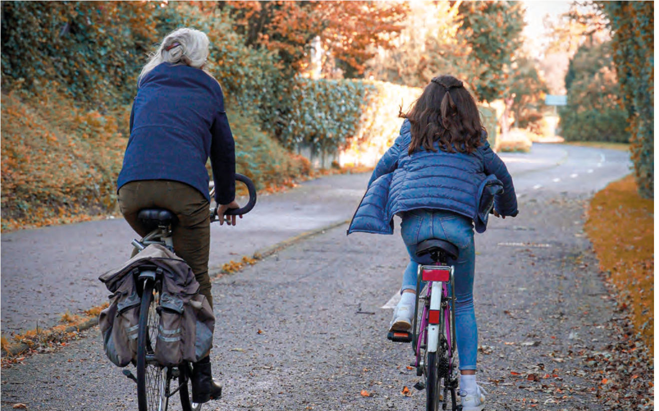
Vélos cours Napoléon Les années à venir feront la part belle au vélo grâce à de nouveaux services et infrastructures conçus pour encourager ce mode de déplacement vertueux. 400 km de pistes cyclables existent déjà sur le territoire de Caen la mer et un périph'vélo est en cours.