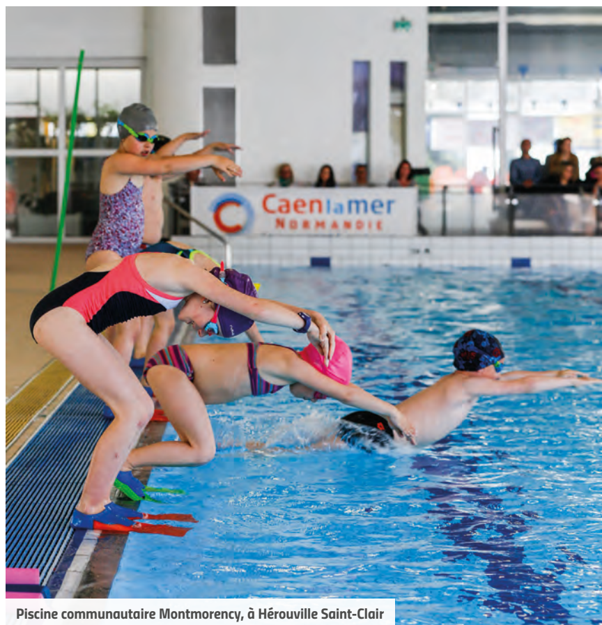
Piscine communautaire Montmorency, à Hérouville Saint-Clair