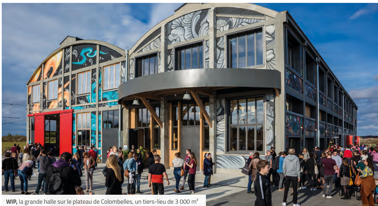
WIP, la grande halle sur le plateau de Colombelles, un tiers-lieu de 3 000 m 2