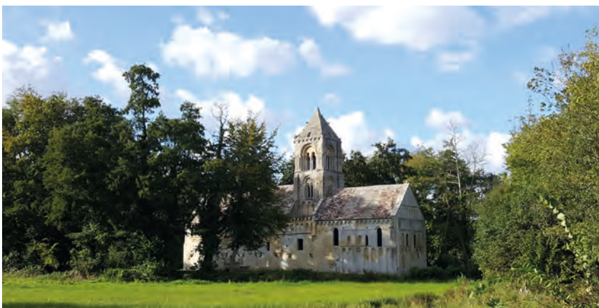
Caen la mer s'ancre dans la richesse de son histoire et de son patrimoine pour mieux se projeter vers l'avenir et construire les solutions innovantes aux problèmes de demain (église Thaon)

Caen la mer, c'est aussi un pôle universitaire de recherche d'envergure nationale et une vie étudiante très riche qui insuffle vitalité et créativité au territoire.